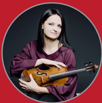
Lana Trotojšek Violin